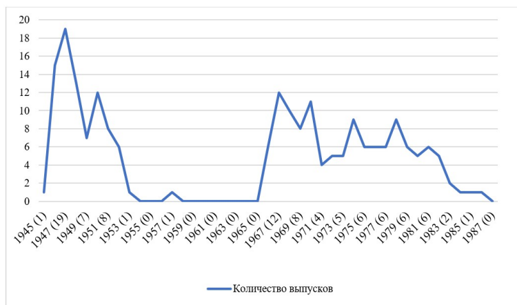
Рис. 3. Диаграмма 1. Количество выпусков «Клуба знаменитых капитанов» 1945–1986 гг.