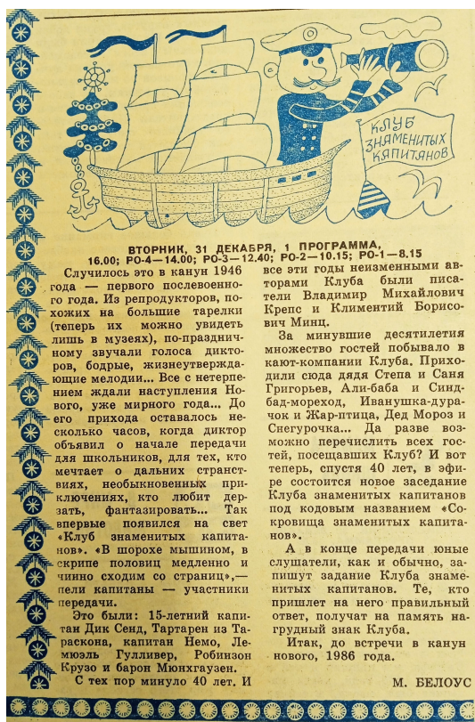
Рис. 1. Анонс встречи «Клуба знаменитых капитанов» 31 декабря 1985 г. Говорит и показывает Москва. Программы центрального телевидения и радиовещания. 1986. № 1, 1 янв. С. 17

В научный оборот впервые вводятся факты, касающиеся выхода «Клуба знаменитых капитанов» в 1957 г., а также в 1983–1986 гг. Выпусков за эти годы немного, но важны факты, во-первых, перерыва в радиомолчании после 1953 г. и, во-вторых, длительность передачи вопреки устоявшейся точке зрения, что финал «Клуба» был в 1982 г.