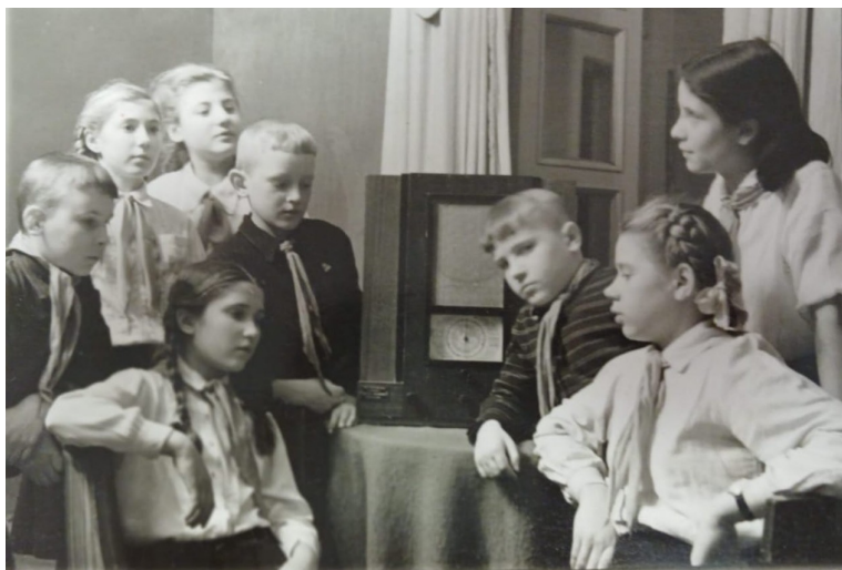
Рис. 5. Группа пионеров слушает радиопередачу из Москвы «Клуб знаменитых капитанов» во Дворце пионеров

обозначался так: «для детей» или «для школьников»; иногда возникали уточнения, для какого именно возраста предполагается передача. Удивляет метаморфоза формулировок от «для детей младшего и среднего школьного возраста» (14, 31 декабря 1947 г.; 3 апреля 1950 г.) до «школьникам и учащимся ПТУ», как была охарактеризована самая последняя передача (14 января 1986 г.). (рис. 5).