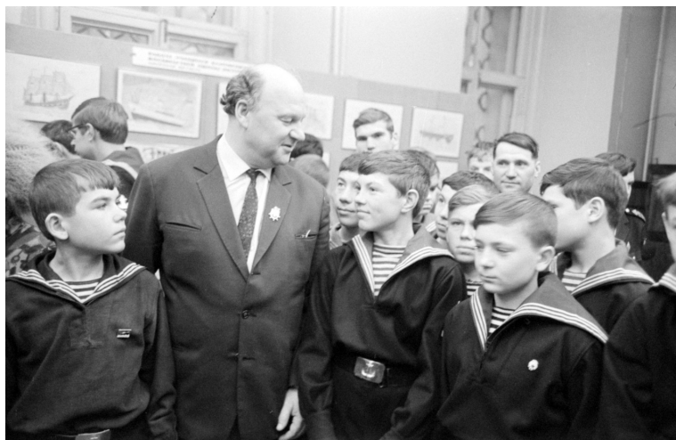
Рис. 4. Народный артист РСФСР И. Д. Воронов, исполнитель роли капитана Немо в радиоспектакле «Клуб знаменитых капитанов», с курсантами военно-морского училища. Фотография А. Н. Агеева, 1970, Москва

из Москвы в январе 1950 г. писали: «вечером 31 декабря мы не услышали в 5 часов позывные „Клуба знаменитых капитанов“. Скажите, пожалуйста, что случилось? Если Вы потерпели крушение, то стоило Вам дать сигнал, и миллионы советских ребят поспешили бы Вам на помощь» [Письма 1948–1951, 45].