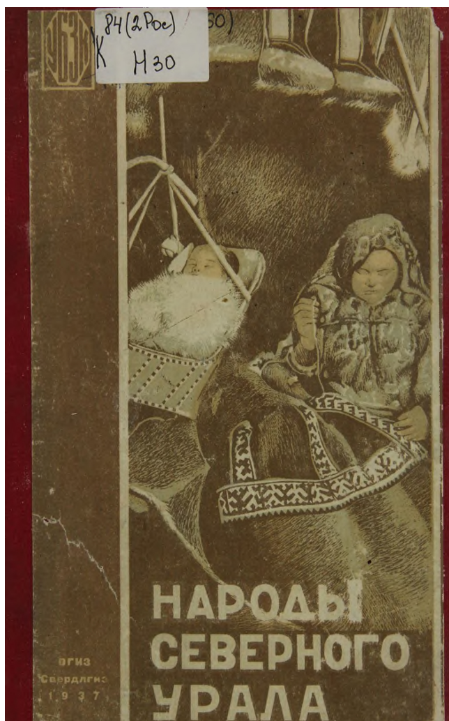
Рис. 2. Народы Северного Урала: Очерки и рассказы (1937). Обложка