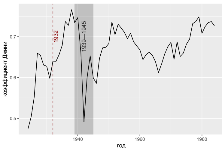
Рис. 3. Неравенство в распределении тиражей между авторами

до 1930-х гг. Если в 1930 г. были изданы книги 933 авторов, то в 1932 г. — только 312. Во время войны падение не настолько резкое, но именно тогда была достигнута самая глубокая «демографическая яма» среди авторов детских книг (153 автора в 1944 г.). К концу 1950-х гг. количество издаваемых авторов постепенно восстанавливается и до конца периода никогда существенно не превышает 1000 в год. По-видимому, этот достигнутый порог отражает организационные возможности централизованного советского книгоиздания, поскольку тиражи продолжают расти, хотя темп роста и замедляется к началу 1980-х гг.