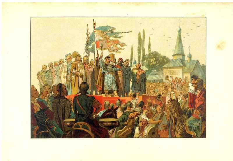
Рис. 5. Иллюстрация М. О. Микешина к повести О. И. Роговой «Богдан Хмельницкий» (СПб., Издательство А. Ф. Девриена, 1888)

В беглом очерке мы не могли дать подробного обзора произведений характеризующих авторов, но старались наметить только главные выдающиеся черты рассматриваемой эпохи (Рис. 5). Направление реальное, стремящееся подготовить ребенка к жизни, рисующее жизнь в обыденном, не в преувеличенном свете без шаблонной морали, появилось в конце шестидесятых годов, рядом с произведениями указанных нами авторов, но оно выросло и окрепло гораздо позднее. В этот же период появилось и тяготение к английской литературе, причем детям давались с одной стороны целиком переведенные английские рассказы или переделки их на русский лад, с другой — компиляции лучших авторов, преимущественно Шекспира, Диккенса, Теккерея. Эта страсть к иноземному так одолела воспитателей, что они наводнили детскую литературу английскими произведениями: дети знакомились с Давидом Копперфильдом, Крошкой Доррид, Шейлоком, «Сном в летнюю ночь» гораздо ранее и основательнее, чем с произведениями своих родных авторов.