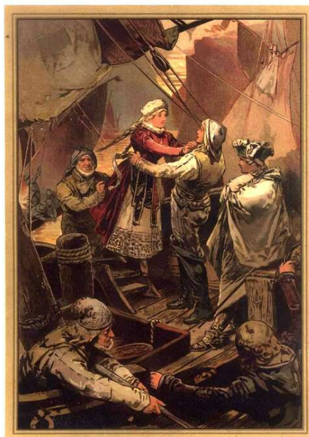
Рис. 2. Роман Т. Мюгге «Афрайя — герой лапландцев» в переводе О. И. Роговой. Фронтиспис работы неизвестного художника (СПб., Издательство А. Ф. Девриена, 1886)