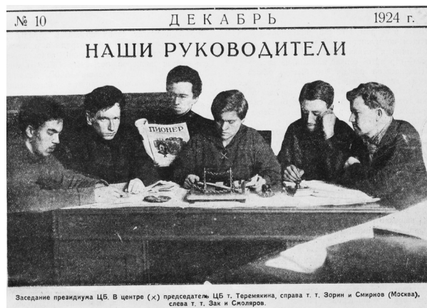
«Наши руководители». Заседание президиума Центрального Бюро пионеров при ЦК РЛКСМ. Фотография из журнала «Пионер». 1924. № 10. С. 1

издания и «усиления» редакций. Отдел печати ЦК комсомола «пересматривает редколлегии» подчиненных ему изданий (См., напр.: [РГАСПИ Ф. М-1. Оп. 23. Д. 244. Л. 64–71]). ЦБ юных пионеров также активно включается в этот процесс 28 .