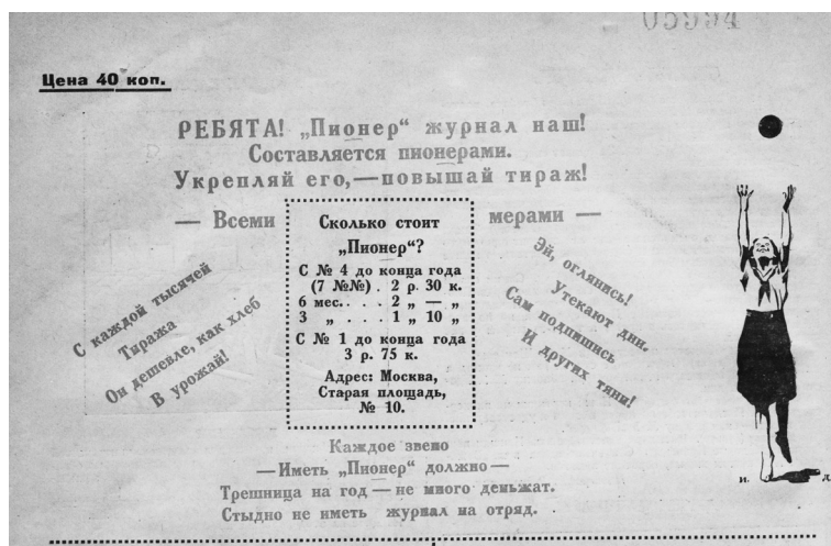
Задняя обложка журнала «Пионер». 1924. № 4

по коммунистическому пути. «Барабан» несколько раз даже назывался «вождем»: он « был всем ребятам — вождем » [Барабан 1925. № 6. Л. 5], он « вождь пролетарских детей » [Б 1924-5-1]. Или, как более емко будет сформулировано уже в начале 1930-х гг. при составлении договора о соревновании между пионерорганизациями по «проработке» изданий и созданию собственных газет, — « Детская печать — вожак и организатор масс » [РГАСПИ Ф. М-1. Оп. 23. Д. 1004. Л. 56]