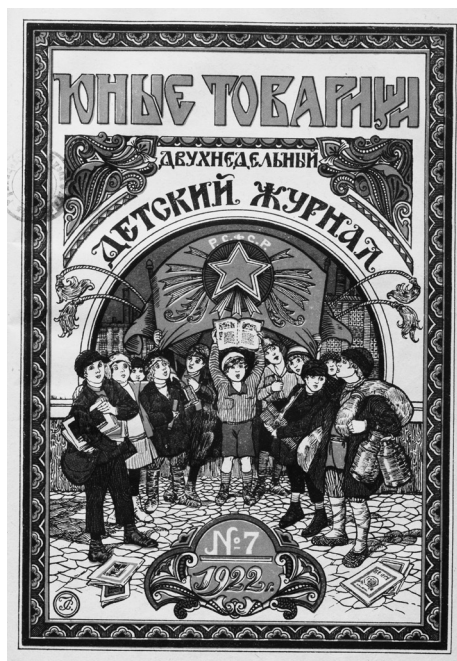
Обложка журнала «Юные товарищи». 1922. № 7

первом проблеске мысли тут же садятся и пишут» [Цит. по Смирнова 2015, с. 99]. Воспитанники этой коммуны тоже издавали газеты и журналы. Одна из рубрик печатного пионерского журнала «Юные товарищи», выходявшего в Москве в 1922 г., называлась «детские журналы и газеты» и была посвящена обзору выходящих (только в Москве!) изданий самодеятельного характера. Издавать их могли как от имени какой-либо школы или детского дома (например, ежемесячный иллюстрированный журнал «Шум» 5-го детского дома), [ЮТ 1922-6-31] 4 , так и более локальной группой (например, газета кружка издателей и репортеров 511 школы-интерната «Наш вестник» или издание Совета Старост ученической организации Первой опытно-показательной школы-коммуны 2 ст. «Коммунар» [ЮТ 1922-7-24]). Доходило и до курьезных проектов: журнал «Красная зоря» позиционировался как журнал 2-й группы 1-й ступени 25-го детского сада [ЮТ 1922-7-25]. Но эклектичное разнообразие создаваемых детьми журналов и газет, которое отражалось на страницах «Юных товарищей», было лишь малой частью поступавшего в редакцию этого издания 5 .