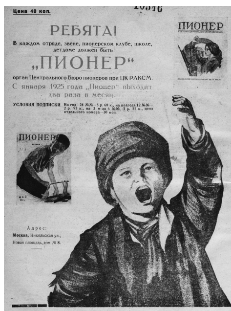
Задняя обложка журнала «Пионер». 1924. № 9

внимание на рекомендацию создать отдел «переписки с читателями» (речь идет о стенных газетах!). Но и стенная газета должна была наглядно сочетать в себе руководящую, инструктивную функцию с доказательством читательской активности — дисциплинировать и руководить через самостоятельную активность читателей.