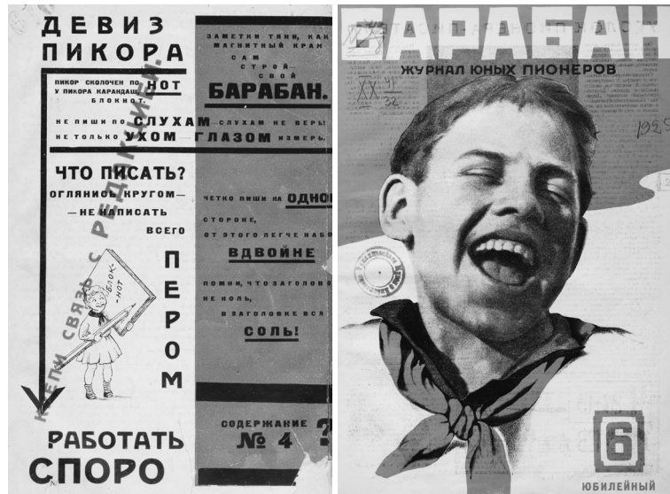
Слева: задняя обложка журнала «Барабан». 1924. № 3. Справа: обложка «юбилейного» номера журнала «Барабан» (два года издания). 1925. № 5

юных пионеров». Про историю существования «Барабана» написано довольно много [см., например: Д'Арканджело 2013]. В настоящей статье я остановлюсь только на нескольких моментах истории создания этого издания и связи его с комсомолом.