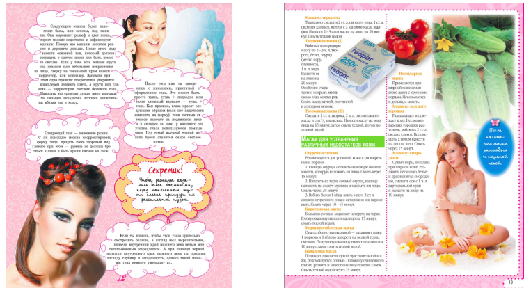
Рис. 1. Энциклопедии последних лет приобретают стилистику глянцевого журнала. Большая энциклопедия для девочек / В. Губина и др. М.: АСТ, 2015. (слева); Большая энциклопедия для девочек / Е. Хомич. М.: АСТ, 2014. (справа)

волну популярности жанр «энциклопедий для девочек» и «энциклопедий для мальчиков» переживает в начале XXI в., сегодня таких изданий выпускается порядка 15 наименований в год, впрочем, пик издательского интереса приходится на 2000-е и 2010-е годы. Отметим, что существенно изменилась форма книг такого рода — сегодняшние гендерные пособия напоминают скорее формат глянцевого журнала или книжки-картинки, а собственно инструктирующего текста в них немного (Рис. 1).